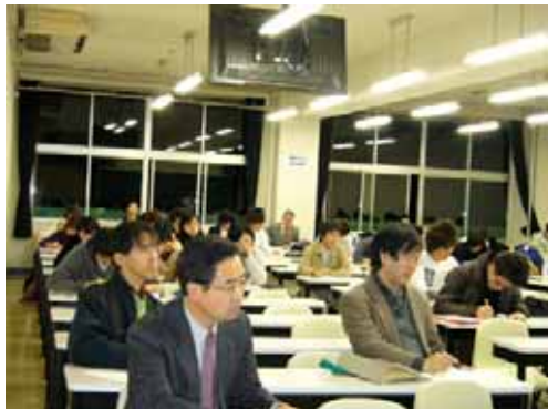
「公開授業」を参観する教員

なお、今回の公開授業を行われた教員より感想などをいただきましたので、掲載させていただきます。