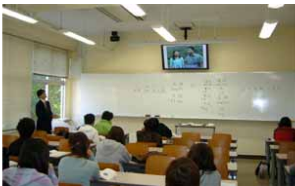
中国語 B (7-304)

参加者が期待(?)に反して少なかったことは今後の課題だが、企画が学内に認知されていなかったのだろう。次回はもっと宣伝を工夫する必要がある。参加者を増やそうと義務づけへ向かうなら、デメリットに転じる恐れがある。第2回FD研修会での名言「避け難い趨勢だからとFDを導入しても何の効果もない」を思い起こすべきだろう。