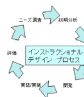
(図表2) インストラクショナル・デザイン

教育に、PDCA(Plan→Do→Check→Action)を意識的に取り入れようとする試み。もちろんe-ラーニングについてのみ用いられる用語ではない。