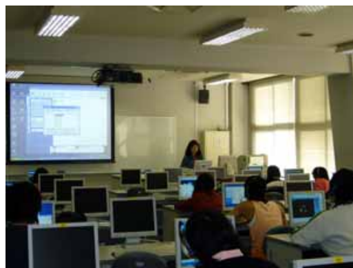
英語 B (再) (4-302)

ことは参考になる点があるのでためになる」というFD推進部会委員の言葉がある一方、自主的に参観する教員が少なかったことである。それならばこれからは全教員に、最低1、2度は公開授業を受け持つようにしてもらったほうがよいのではないだろうか。それではじめて当事者意識も芽生えるだろう。また、「何のためにおこなう公開授業なのか」という点は反省会でも依然として曖昧なままだった。公開授業はモデル授業とは異なっているはずであり、私ば「普段どおりの授業をしてください」といわれた。このため学生にも公開授業についての情報はわざと伝えなかった。公開授業をひきうけてくださった先生方にもそのように伝えた。だが、学生に「来週は公開授業だから遅れないように」とか「活発に発表するように」といった要請をあらかじめだしておいたという教員も少なくなかったようである。このこと自体、FD推進部会からだされていた「普段どおりの授業をおこなってほしい」という要請とは異なる。(だが、委員からは、それにもかかわらず学生たちは従来と変わらない態度だったのでがっかりしたといった声もきかれたが・・・)今回の公開授業が「モデル授業」ならばそのようにはじめから位置づけるべきであろうし、それならば学外から人を呼んで上手な授業をしてもらうことも可能であろう。しかし学生へのサービス向上の一環として考えるならば、なるべく普段と同じ状況で、授業の目標は何なのかを参加者に伝え、担当者が直面している現実的な問題をそのままみせるほうがよいのではないだろうか。むろん少しでもよくみせたいというのは教員の性であるけれども、そこに他者の目が加わることで「思わぬ改善の糸口」があるかもしれないのだから。