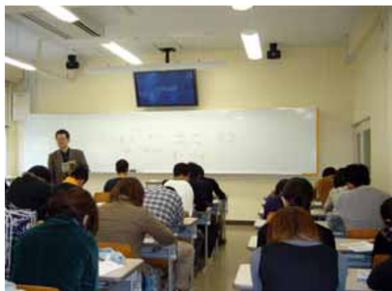
中国語 B (7-302)

それより、人の授業を見ると自分では考え付かないことがあって面白い。今回も教科書をバラバラにして提出させるのを見て驚いた。確かに、語学のテキストは読むより使うという類のものかも知れない。早速真似してみようと思った次第である。