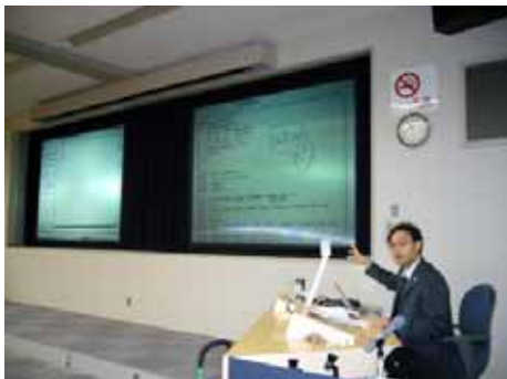
コンピュータ・ワークショップ(1-201)

プログラミング言語の発展的利用を目的としたコンピュータ・ワークショップ(今期から開講)において、公開授業という貴重な体験を通じ、ご参加いただいた教職員の皆様から多様なご意見をいただきました。本質的な課題として、「人数制限のない実習の講義において、履修者が過多となった場合、その人数に応じた補助員が必要である」というご指摘を多数いただきました。本講義は約80名の履修者がいるが、これは単一の教員、ならびに、補助の教員という二名のみでは、学生一人一人への個別な対応が切実に困難となっている。「毎講義の出席・進捗を電子的に報告させているが、この仕組み自体が効率的」というご感想もいただきました。本講義の履修人数を前提とした場合、個々の学生のフォロー、モニタリングが弱くなるとの予想があったため、講義に先立ってWebによる厳密な出席管理、ならびに、成果物の細かな報告を行わせる課題提出システムを構築し、本講義において運用している。