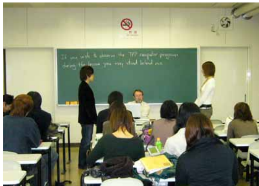
Oral Communication (1-501)

Students are randomly paired, converse until a mistake is made they do not notice, at which time the conversation is stopped and the error pointed out. The computer then randomly calls up another pair. TPP teaches students how to converse naturally in English and at the same time provides empirical data upon which evaluations are based.